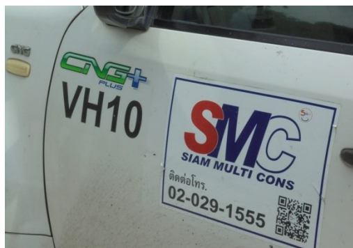
ภาพที่ 4-19 ติดป้ายเบอร์โทรติดต่อไว้ที่รถของผู้รับเหมาก่อสร้าง