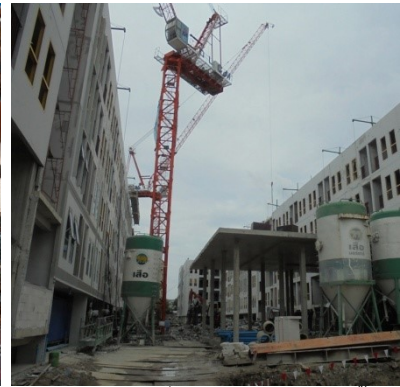
ภาพที่ 4-24 สวมใส่อุปกรณ์ป้องกันภัยส่วนบุคคลในการทำงานให้มีความปลอดภัย และแนวทาวเวอร์เครนยื่นภายในโครงการเท่านั้น