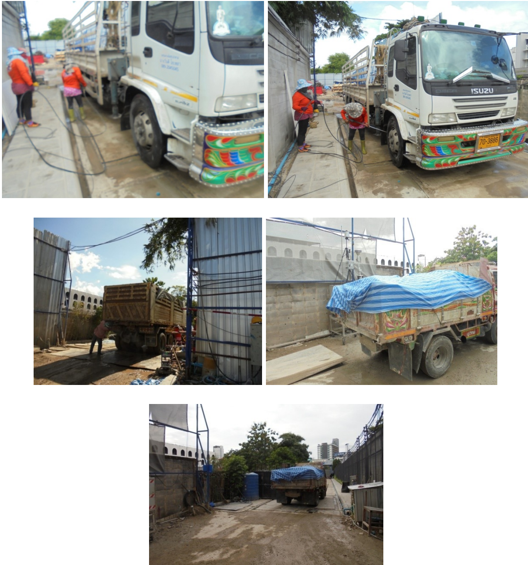
ภาพที่ 4-11 ล้างล้อรถบรรทุกด้วยสายฉีดน้ำแรงดันสูง และปิดคลุมท้ายกระบะบรรทุกดินอย่างมิดชิด