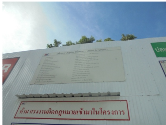
ภาพที่ 4-1 ป้ายรายละเอียดโครงการ