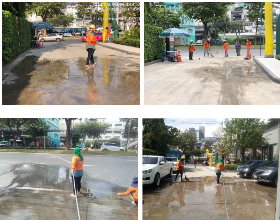
ภาพที่ 4-14 กวาดทำความสะอาดเศษดินบริเวณถนนทางเข้าออกโครงการทุกวัน และฉีดรดไว้ภายในโครงการบริเวณริมทางที่เว้นไว้จอดรถ