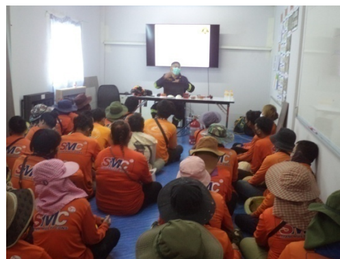
ภาพที่ 4-23 กิจกรรม Morning Talk เป็นประจำทุกวันก่อนเริ่มการปฏิบัติงาน และการอบรมคนงานด้านความปลอดภัย