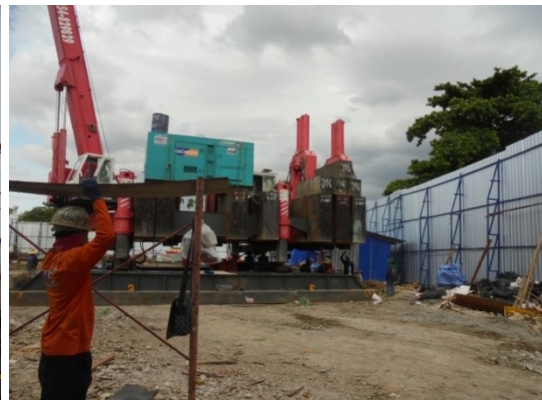
ภาพที่ 4-10 ใช้เครื่องจักรทำเสาเข็ม วิธีเสาเข็มกด