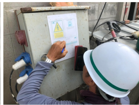
ภาพที่ 4-25 ตรวจสอบอุปกรณ์ไฟฟ้าภายในโครงการสม่ำเสมอ