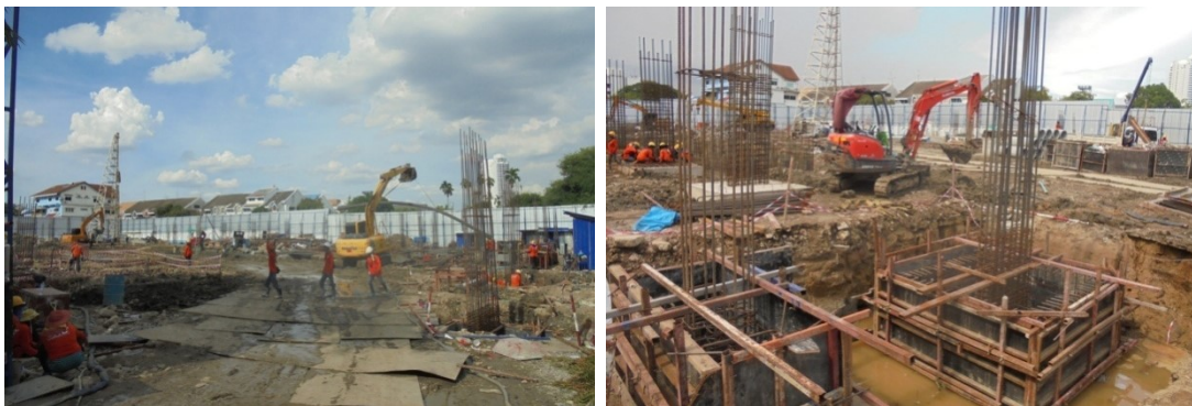
ภาพที่ 4-12 ก่อสร้างฟุต汀อาคารและปรับปรุงพื้นที่หลังจากทำเสาเข็มฐานรากแล้วเสร็จ