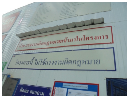
ภาพที่ 4-2 ป้ายความปลอดภัย และไม่ใช่แรงงานที่ผิดกฎหมาย