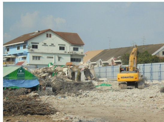
ภาพที่ 4-7 ขณะทำการรื้อถอนอาคารเดิมชิดพรมน้ำป้องกันฝุ่นละอองฟุ้งกระจาย ใช้เครื่องจักรหนักในการรื้อถอน