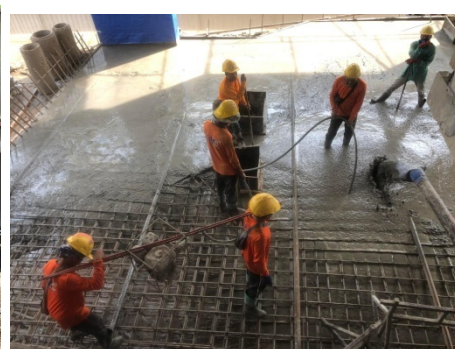
ภาพที่ 4-26 วิศวกรโครงการดูแลตรวจสอบการทำงานให้มีความปลอดภัยอย่างใกล้ชิด