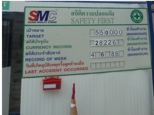
ภาพที่ 4-5 ป้อมยามรักษาความปลอดภัยด้านหน้าทางเข้าโครงการ และป้ายสถิติการเกิดอุบัติเหตุ