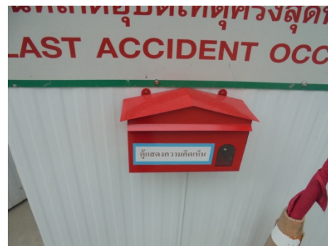
ภาพที่ 4-6 ป้ายอันตราย เขตการก่อสร้าง และกล่องรับความคิดเห็นด้านหน้าโครงการ