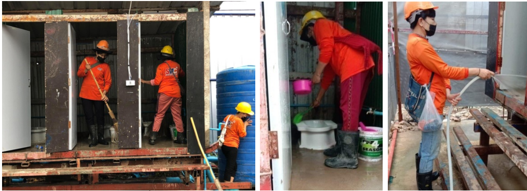
ภาพที่ 4-8 ห้องน้ำชั่วคราวและการล้างทำความสะอาดอย่างสม่ำเสมอ