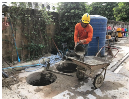
ภาพที่ 4-21 จุดลอกตะกอนที่บ่อพักน้ำทั้งก่อนระบายออกสู่ภายนอกโครงการ