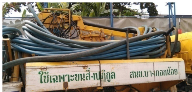
ภาพที่ 4-27 สูบตะกอนระบบบำบัดน้ำเสียโดยประสานให้สำนักงานเขตบางกอกน้อยมาสูบกำจัด