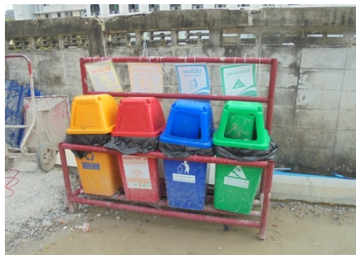
ภาพที่ 4-17 ถึงรองรับมูลฝอยแยกชนิดมูลฝอย