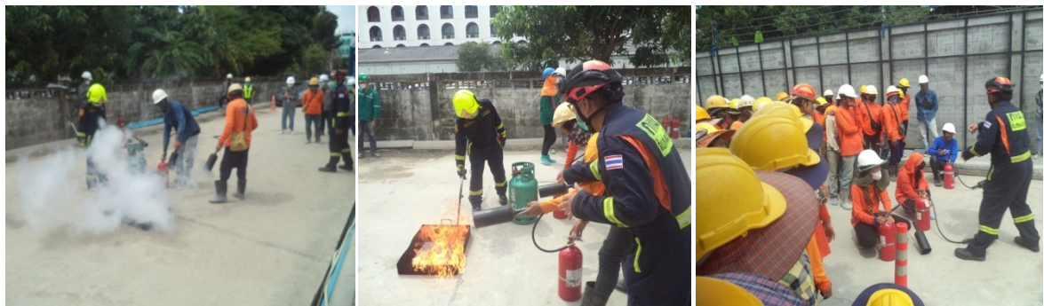
ภาพที่ 4-28 ซ้อมดับเพลิงประจำปี 2565