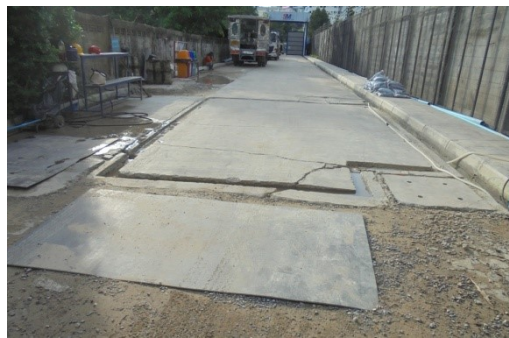
ภาพที่ 4-20 จุดล้างล้อรถก่อนออกจากโครงการ