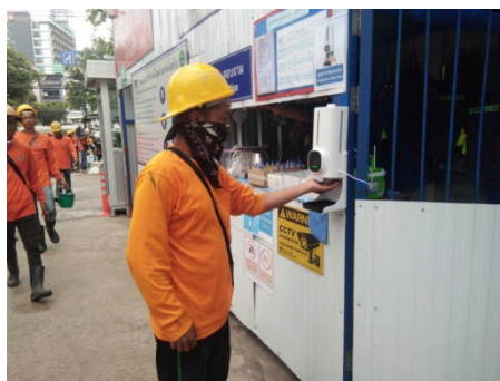
ภาพที่ 4-22 ตรวจวัดอุณหภูมิร่างกายก่อนเข้าปฏิบัติงานทุกวัน