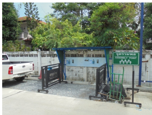
ภาพที่ 4-15 จุดพักมูลฝอยด้านหน้าโครงการ และจุดสแกนนิ้วก่อนเข้าทำงานของคนงานก่อสร้าง