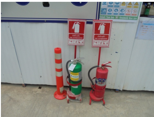
ภาพที่ 4-16 ถึงเคมีดับเพลิงตั้งไว้บริเวณที่เสี่ยงต่อการเกิดเพลิงไหม้พร้อมคู่มือการใช้งาน