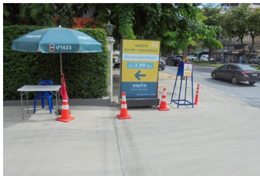
ภาพที่ 4-18 ไฟกระพริบ และป้ายแจ้งว่ามีรถบรรทุกวิ่งเข้าออกบริเวณทางเข้า-ออกโครงการ