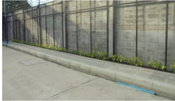
ภาพที่ 4-4 รั้วชั่วคราวสูง 6 เมตรและถนนทางเข้าโครงการ