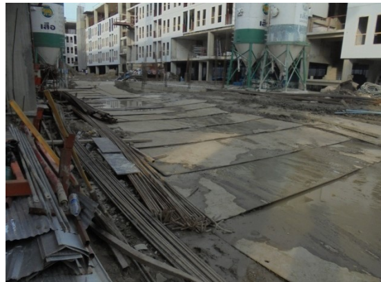
ภาพที่ 4-9 ปรับสภาพพื้น บดอัดให้เป็นที่เรียบ วางเหล็กหนาเพื่อเตรียมการทำเสาเข็มฐานราก