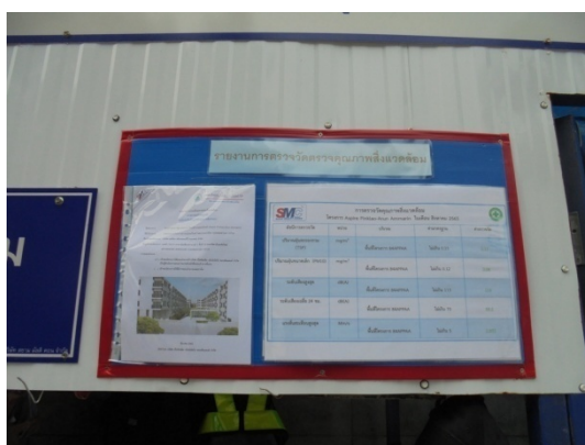
ภาพที่ 4-3 มาตรการติดตามตรวจสอบผลกระทบสิ่งแวดล้อมและผลการตรวจวัดคุณภาพสิ่งแวดล้อมช่วงเสาเข็มฐานราก