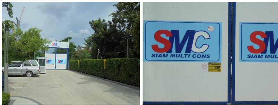
ภาพที่ 4-13 ประตูเข้า-ออก ปิดไว้เสมอ เปิดเฉพาะเมื่อมีรถวิ่งเข้า-ออก