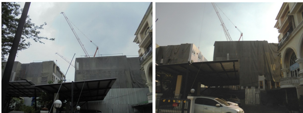
ภาพที่ 4-31 ปิดคลุมอาคารด้วยผ้าใบชนิดกันไฟลาม