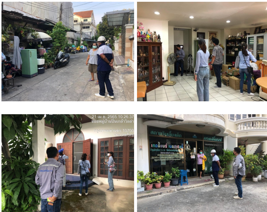
ภาพที่ 4-29 เจ้าหน้าที่โครงการเข้าพบปะพูดคุยกับเจ้าของอาคารข้างเคียง